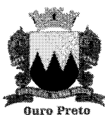
Vereador Zé do Bimba - PV Presidente da Câmara Municipal de Ouro Preto