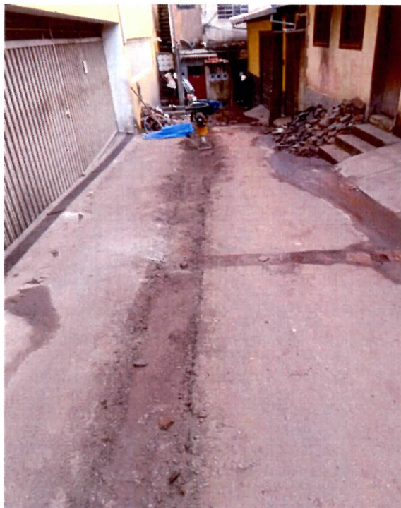
Imagem 02: Substituição da rede de abastecimento antiga por rede de DN50