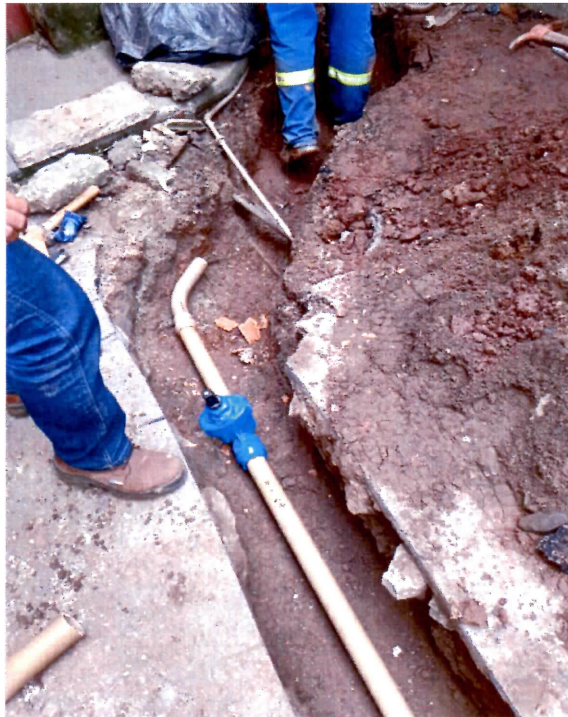
Imagem 01: Substituição da rede de abastecimento antiga por rede de DN50