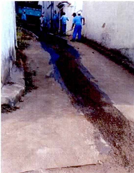
Imagem 03: Recomposição asfáltica da Rua Othon Guimarães após finalização da substituição de rede de abastecimento

Nada mais havendo a se tratar, me despeço e me coloco à disposição para qualquer esclarecimento que se fizer necessário.