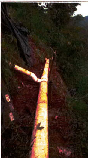
Imagem 03: Reparo de rede de esgoto finalizado, Rua Águas Férreas, nº 959, Bairro Taquaral (04/11/2021)

Nada mais havendo a tratar, me despeço e me coloco à disposição para qualquer esclarecimento que se fizer necessário.