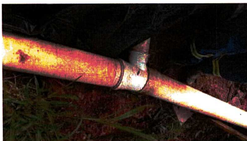
Imagem 01: Reparo de rede de esgoto, Rua Águas Férreas, nº 959, Bairro Taquaral (04/11/2021)

As Imagens de 01 a 03, a seguir, comprovam a execução ação pelos colaboradores da Concessionária durante as intervenções.