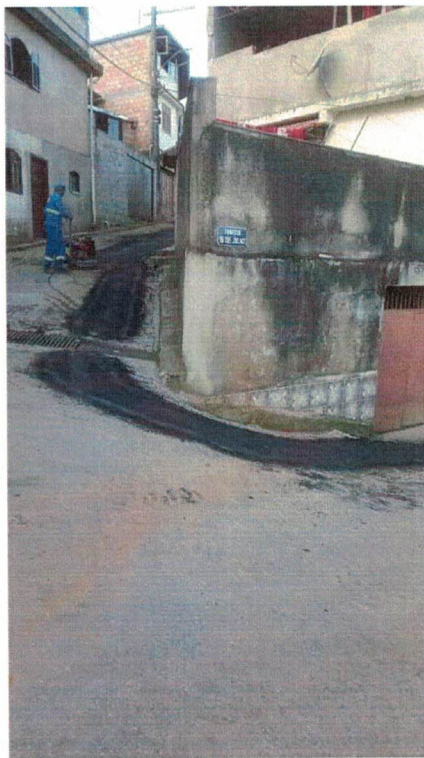
REPAVIMENTAÇÃO OBRAS DE SUBSTITUIÇÃO/REMANEJAMENTO DE REDE RUA QUINZE DE NOVEMBRO E TRAVESSA DEZESSEIS DE JULHO, MORRO SANTANA (20/JAN/2022)

Nada mais havendo a tratar, me despeço e me coloco à disposição para qualquer esclarecimento que se fizer necessário.