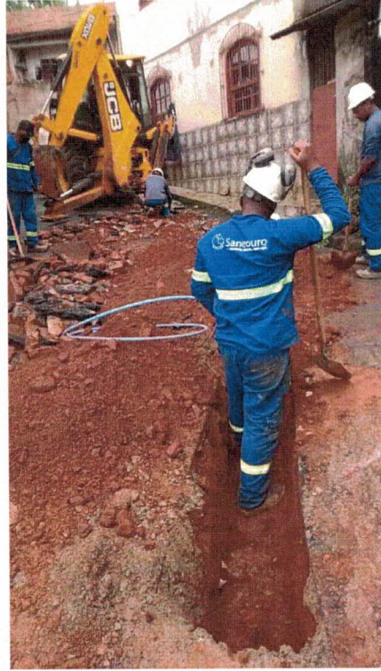
OBRAS DE SUBSTITUIÇÃO/REMANEJAMENTO DE REDE RUA QUINZE DE NOVEMBRO E TRAVESSA DEZESSEIS DE JULHO, MORRO SANTANA (JAN/2022)