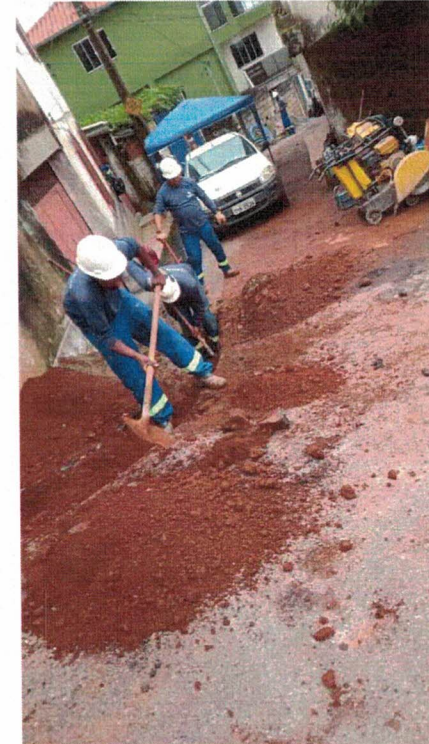
OBRAS DE SUBSTITUIÇÃO/REMANEJAMENTO DE REDE RUA QUINZE DE NOVEMBRO E TRAVESSA DEZESSEIS DE JULHO, MORRO SANTANA (JAN/2022)