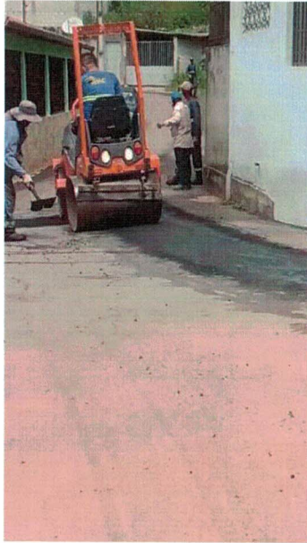
REPAVIMENTAÇÃO ASFÁLTICA RUA SINHÁ OLÍMPIA, BAUXITA (01/04/2022)