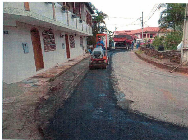
REPAVIMENTAÇÃO ASFÁLTICA RUA ANTÔNIO DE PÁDUA ARAÚJO, BAUXITA (01/04/2022)