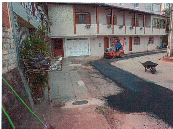
REPAVIMENTAÇÃO ASFÁLTICA RUA ANTÔNIO DE PÁDUA ARAÚJO, BAUXITA (01/04/2022)

Atendendo ao solicitado, a Concessionária encaminha, para conhecimento, imagens que comprovam a finalização dos serviços de repavimentação asfáltica, após à conclusão de obras de ampliação/substituição de rede de água, às Ruas Antônio de Pádua Araújo e Sinhá Olímpia, bairro Bauxita, executados durante o dia 01 de abril do corrente.