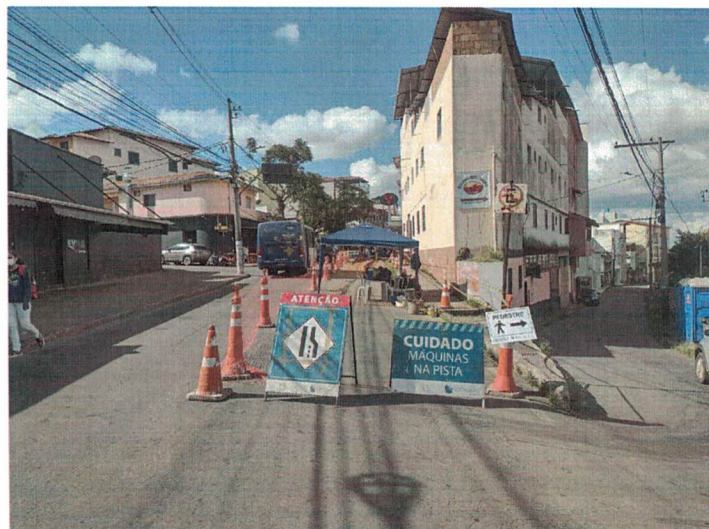
ÍNICIO OBRAS DE REDE DE ÁGUA, RUA PROF. PAULO MAGALHÃES GOMES, MORRO DO CRUZEIRO (18/04/2022)

Nada mais havendo a tratar, me despeço e me coloco à disposição para qualquer esclarecimento que se fizer necessário.