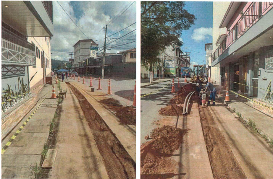
ÍNICIO OBRAS DE REDE DE ÁGUA, RUA PROF. PAULO MAGALHÃES GOMES, MORRO DO CRUZEIRO (18/04/2022)