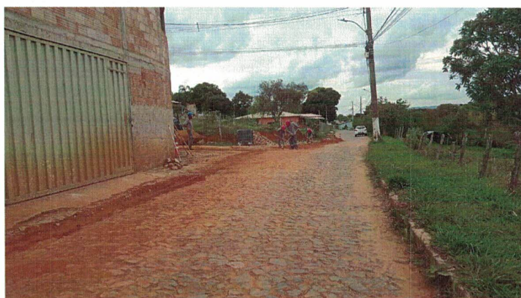
OBRAS DE REMANEJAMENTO DE REDE DE ÁGUA, RUA SANTA CRUZ, 351, GLAURA (OUT/2021)

Nada mais havendo a tratar, me despeço e me coloco à disposição para qualquer esclarecimento que se fizer necessário.