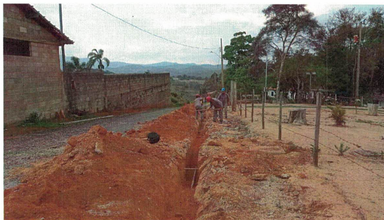
OBRAS DE REMANEJAMENTO DE REDE DE ÁGUA, RUA SANTA CRUZ, 351, GLAURA (OUT/2021)