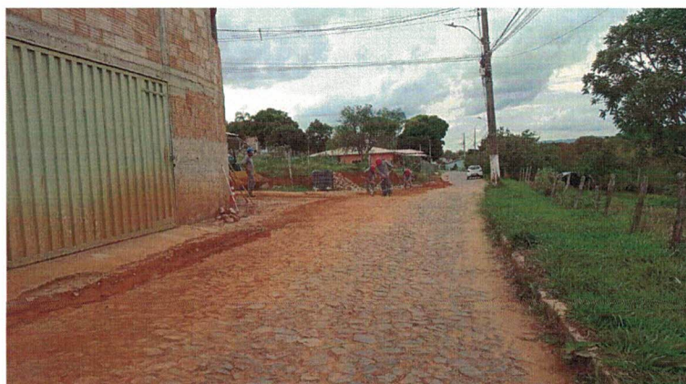
OBRAS DE REMANEJAMENTO DE REDE DE ÁGUA, RUA SANTA CRUZ, 351, GLAURA (OUT/2021)