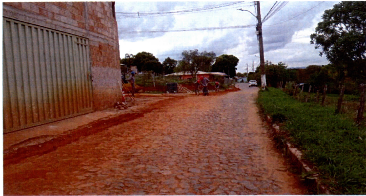
OBRAS DE REMANEJAMENTO DE REDE DE ÁGUA, RUA SANTA CRUZ, 351, GLAURA (OUT/2021)

Nada mais havendo a tratar, me despeço e me coloco à disposição para qualquer esclarecimento que se fizer necessário.