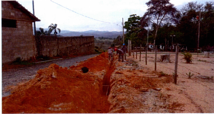
OBRAS DE REMANEJAMENTO DE REDE DE ÁGUA, RUA SANTA CRUZ, 351, GLAURA (OUT/2021)