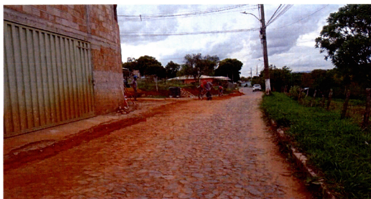
OBRAS DE REMANEJAMENTO DE REDE DE ÁGUA, RUA SANTA CRUZ, 351, GLAURA (OUT/2021)