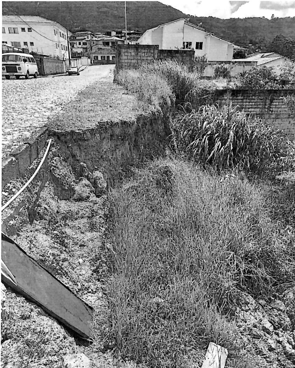
FOTO 2: erosão avançou até o limite do meio-fio da rua Luciano Francisco Pereira.