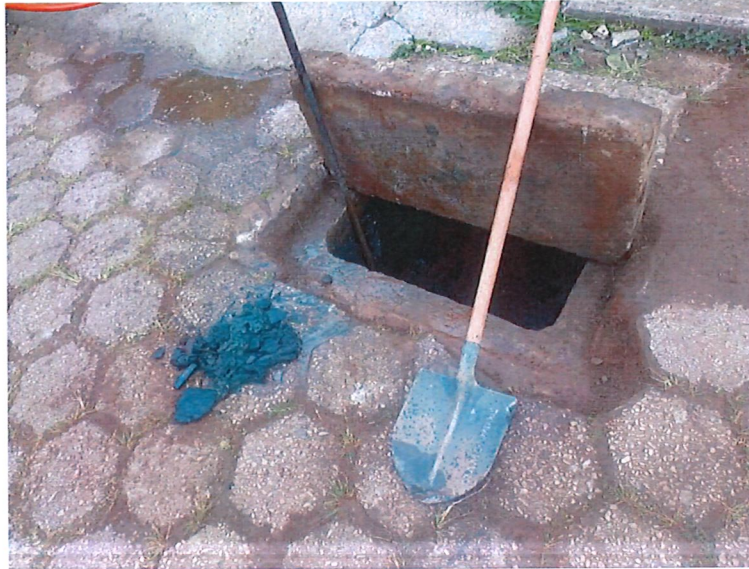
REDE DE ESGOTO RUA ANTÔNIO DE PÁDUA ARAÚJO, BAIRRO BAUXITA, PROTOCOLO Nº 2905222

Cumpre-nos aqui recordar que o lançamento de irregular de resíduos, que por suas características exijam tratamento prévio, à rede coletora de esgoto se configura como infração, passível de penalidades, conforme dispõe a Lei Municipal nº 1.126/2018 que trata do Regulamento de Serviços de Abastecimento de Água e Esgotamento Sanitário do Município. Importante ainda ressaltar a importância da população no sentido de realizar o descarte de resíduos de maneira correta, não despejando qualquer tipo de lixos pelos ralos, pias, vasos sanitários.