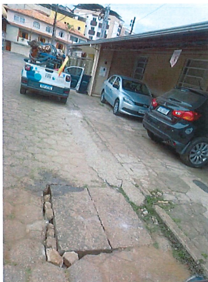
REDE DE ESGOTO RUA ANTÔNIO DE PÁDUA ARAÚJO, BAIRRO BAUXITA, PROTOCOLO Nº 2949096

REDE DE ESGOTO RUA ANTÔNIO DE PÁDUA ARAÚJO, BAIRRO BAUXITA PARECER DE SERVIÇO, PROTOCOLO Nº 2949096