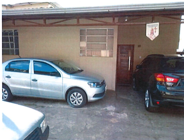
REDE DE ESGOTO RUA ANTÔNIO DE PÁDUA ARAÚJO, BAIRRO BAUXITA, PROTOCOLO Nº 2940032