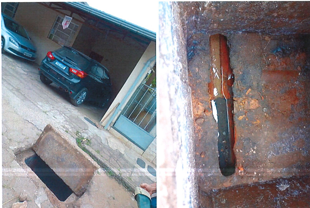
REDE DE ESGOTO RUA ANTÔNIO DE PÁDUA ARAÚJO, BAIRRO BAUXITA, PROTOCOLO Nº 2949096

Ainda, a título de informação, considerando que o ramal de esgoto da residência de nº 20 foi construído praticamente à mesma cota da rede pública coletora, e considerando a previsão legal de que toda edificação seja dotada de válvula de retenção, a equipe de colaboradores da Saneouro orientou o proprietário do imóvel a realizar a instalação do equipamento, para minimizar a ocorrência de retorno de esgoto.