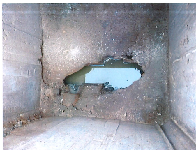
REDE DE ESGOTO RUA ANTÔNIO DE PÁDUA ARAÚJO, BAIRRO BAUXITA, PROTOCOLO Nº 2940032