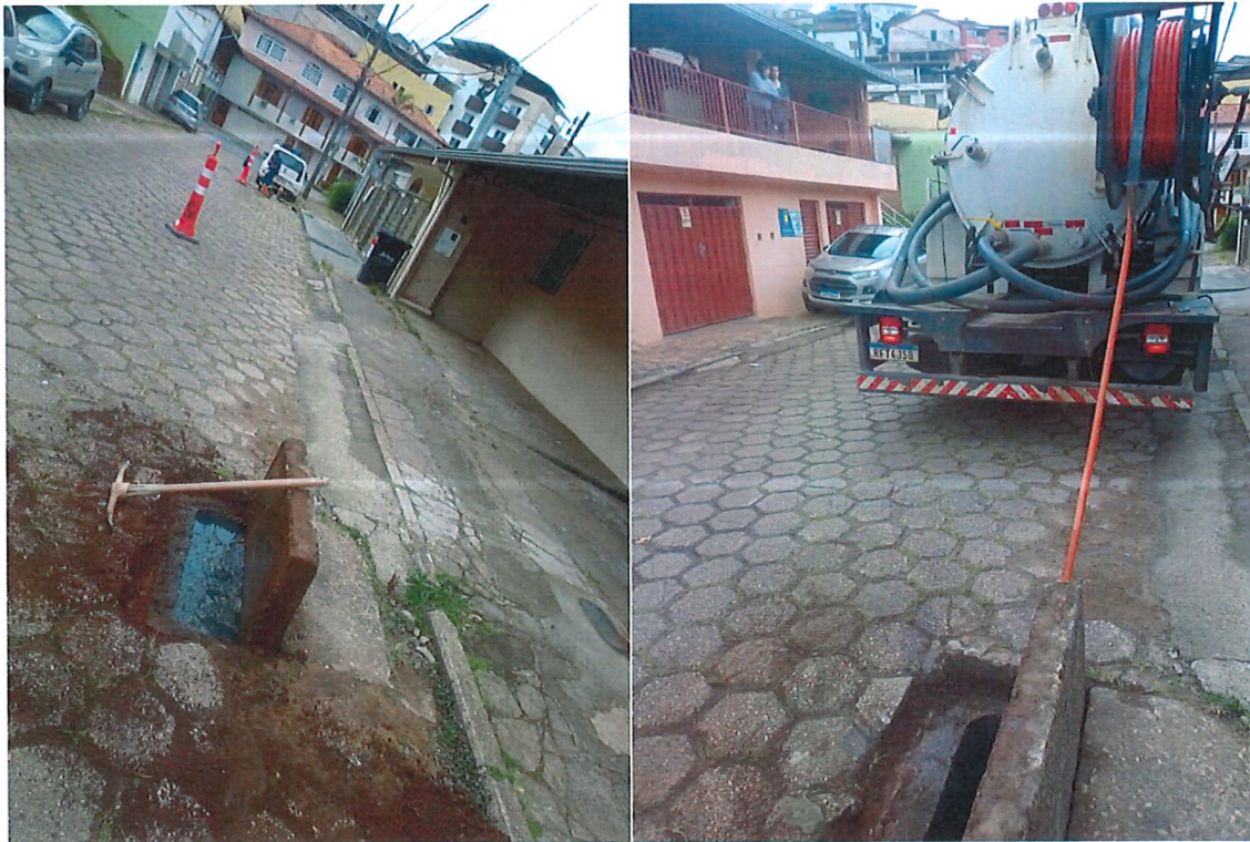
REDE DE ESGOTO RUA ANTÔNIO DE PÁDUA ARAÚJO, BAIRRO BAUXITA, PROTOCOLO Nº 2905222

REDE DE ESGOTO RUA ANTÔNIO DE PÁDUA ARAÚJO, BAIRRO BAUXITA PARECER DE SERVIÇO, PROTOCOLO Nº 2905222