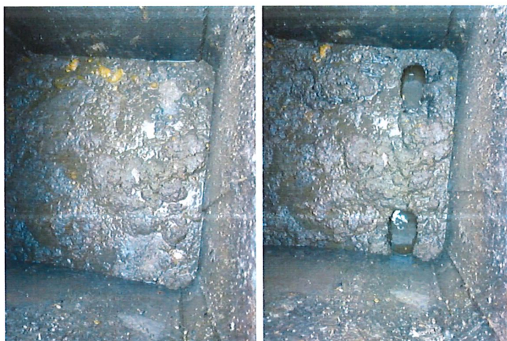
REDE DE ESGOTO RUA ANTÔNIO DE PÁDUA ARAÚJO, BAIRRO BAUXITA, PROTOCOLO Nº 2940032