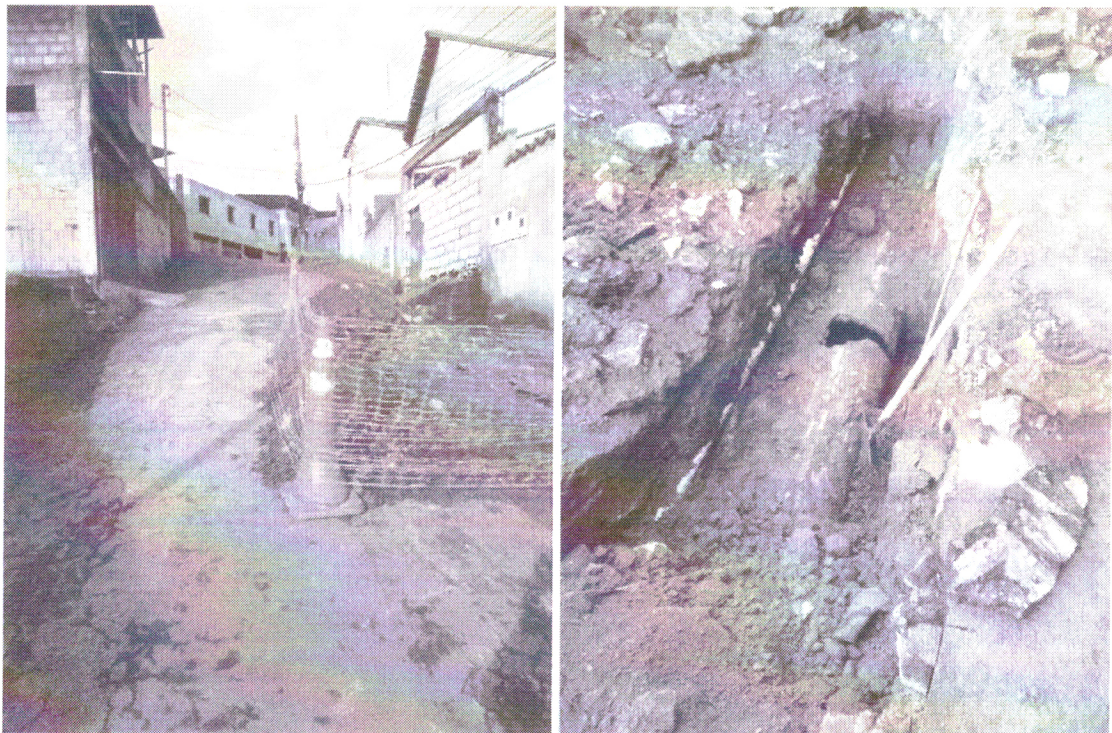
VISTORIA RUA DOS JASMINS, BAIRRO SANTA CRUZ (31/10/2023)

Apurou-se, entretanto, a existência de intervenções à via e a ocorrência de vazamento proveniente da manilha coletora de água pluvial, conforme comprovado na imagem a seguir, cuja responsabilidade de reparo compete à Secretaria de Obras.