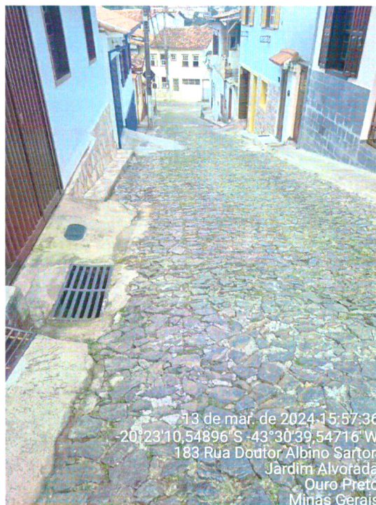
VISTORIA REDE DE ESGOTO, RUA DR. ALBINO SARTORI, Nº 120, VILA SÃO JOSÉ