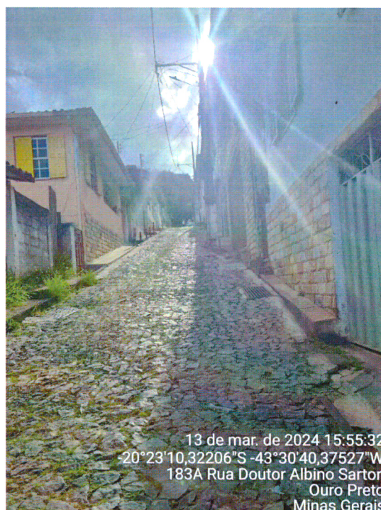
VISTORIA REDE DE ESGOTO, RUA DR. ALBINO SARTORI, Nº 120, VILA SÃO JOSÉ