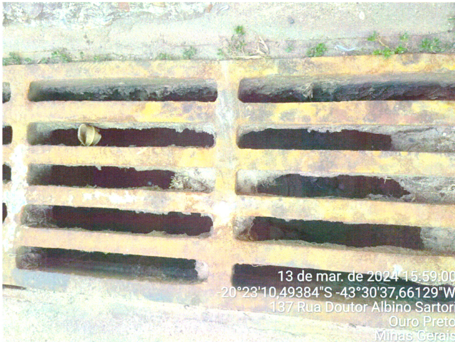
VISTORIA REDE DE ESGOTO, RUA DR. ALBINO SARTORI, Nº 120, VILA SÃO JOSÉ