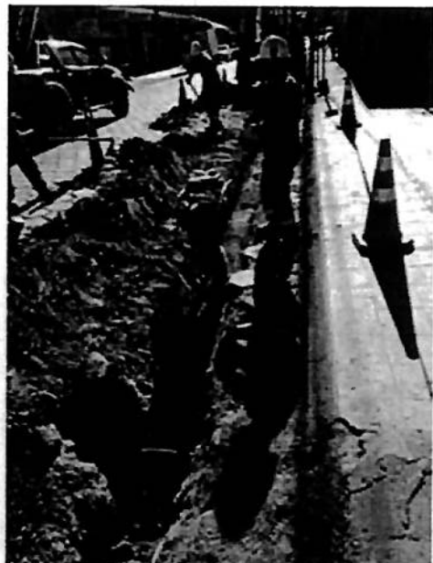
REPARO REDE DE ESGOTO, RUA PADRE PEDROSA, AMARANTINA, PROTOCOLO Nº 3039775 (16/05/2024)