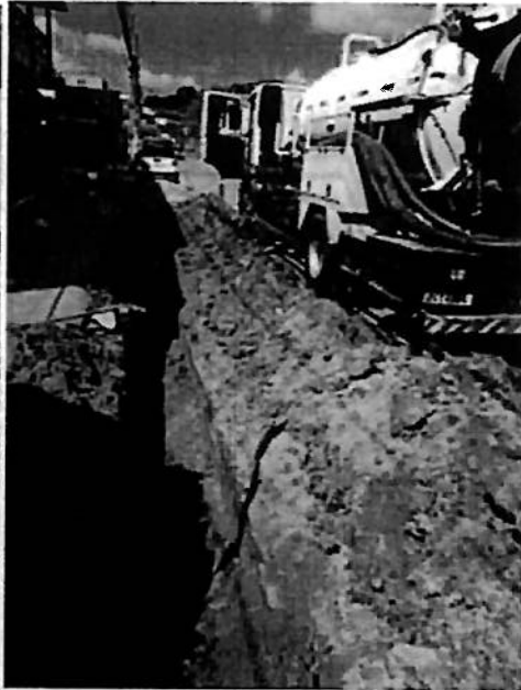
REPARO REDE DE ESGOTO, RUA PADRE PEDROSA, AMARANTINA, PROTOCOLO Nº 3039775 (16/05/2024)