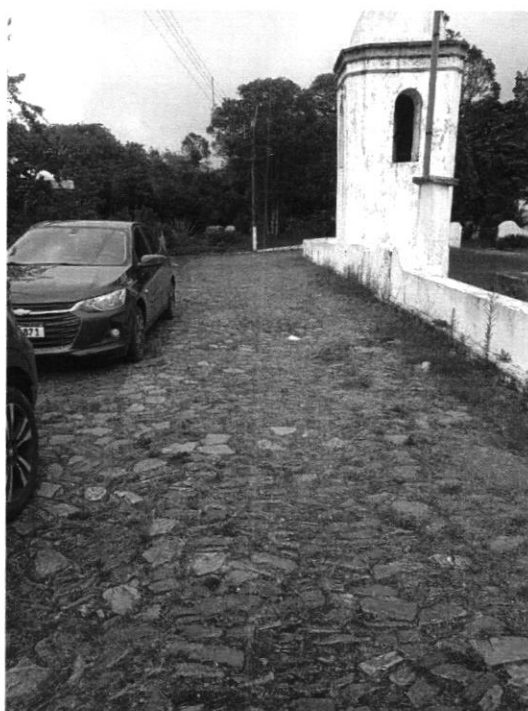
EXECUÇÃO DE VISTORIA EM REDE DE ABASTECIMENTO À RUA RIO GRANDE, MORRO SÃO SEBASTIÃO (02/12/2024)