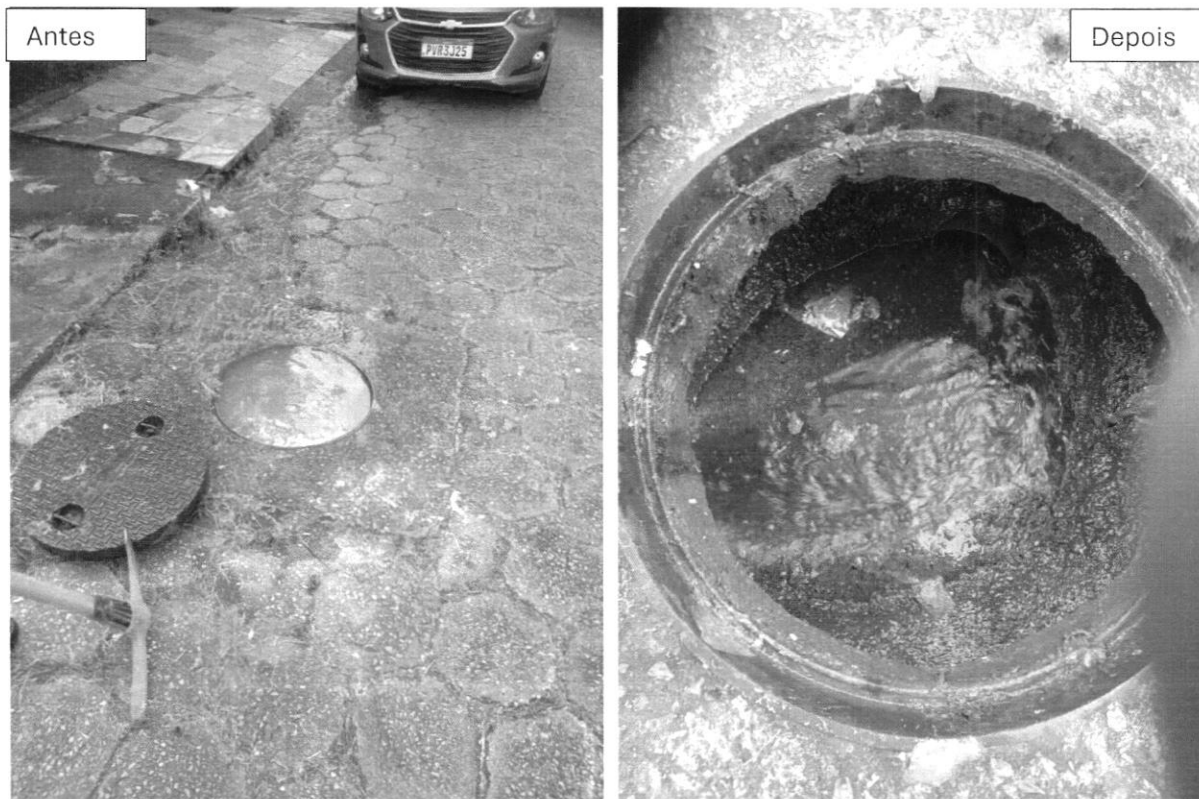
EXECUÇÃO D INTERVENÇÃO DE DESOBSTRUÇÃO DE REDE DE ESGOTAMENTO SANITÁRIO SITUADA À RUA DOMINGOS BARROSO, LOCALIZADA NA VILA DOS ENGENHEIROS (02/12/2024)