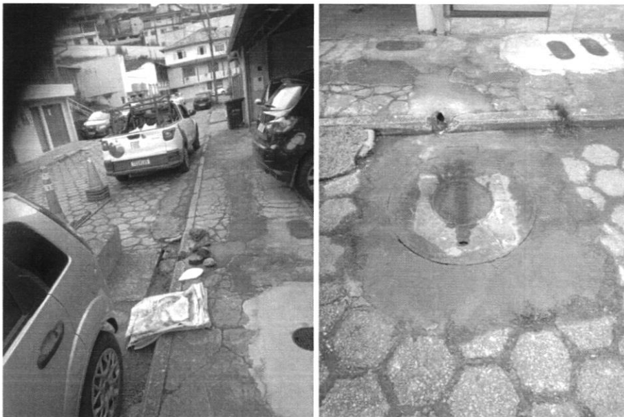
SUBSTITUIÇÃO TAMPA PV ESGOTO E CALAFETAÇÃO, RUA ANTÔNIO DE PÁDUA ARÁUJO (PROTOCOLO Nº 3101059)

Nada mais havendo a tratar, me despeço e me coloco à disposição para qualquer esclarecimento que se fizer necessário.