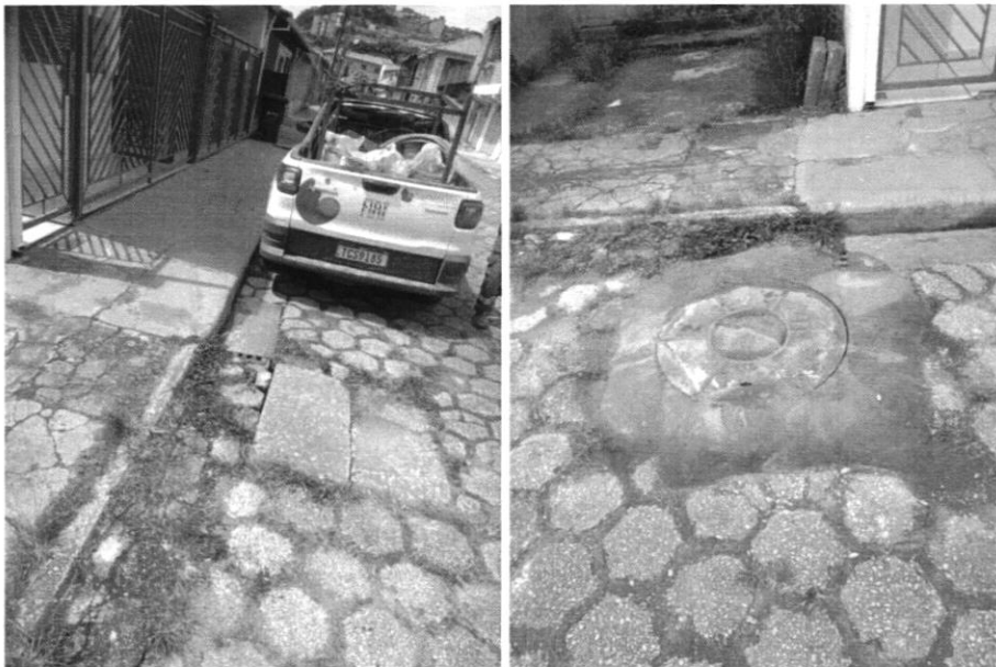
SUBSTITUIÇÃO TAMPA PV ESGOTO E CALAFETAÇÃO, RUA ANTÔNIO DE PÁDUA ARÁUJO (PROTOCOLO Nº 3100781)